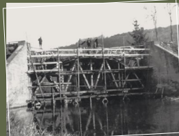
Paul Maden.