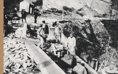
Photos of war reconstruction in "Habskirchen" near Boulaide.