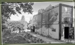
AUSSTELLUNG „LAND OF MEMORY – OUR COMMON HERITAGE“ IN BAUSCHLEIDEN

Eine immersive und partizipative Erfahrung bildet die Wanderausstellung „Land of Memory – Our common Heritage“, welche nach mehreren Zwischenstationen nun dauerhaft in Bauschleiden zu sehen ist.